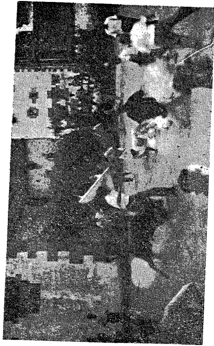
Un momento de las vaquillas el cuarto día por la tarde

Y ya por quedar mal hasta el simpático Pello me hizo la jugada y salió a torear el cuarto día. Claro que