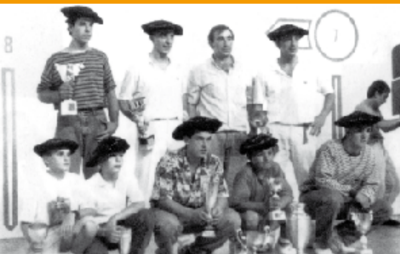
1992an Goizuetak irabazi zuen Herriarteko Pilota txapelketa. Baita aurreko urtean ere. Ordukoa da argazki hau.