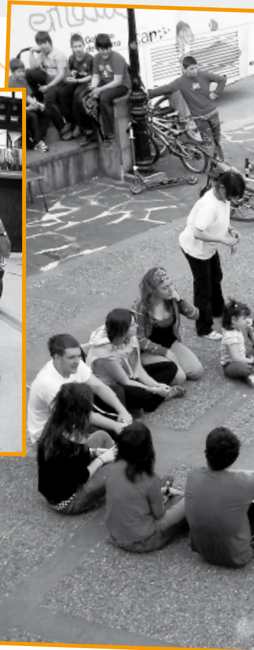
Aste Santuak. Umekin jolasak 2010.

Iruditzen zait, kontzertu asko egin direla geroztik, baina hainbeste jende ekarri duena ezetz. Baina haiek garai onak ziren kontzertuentzako. Gehienoi lana egitea tokatu zitzaigun, gogorra izan zen, baina ongi pasa genuen.