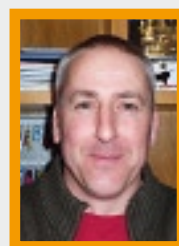
Daniel Oyarzabal • 11