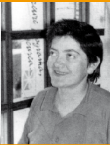
Bekoetxeko Jeanek eskulanak erakutsi zizkien argazkiko emakume hauei.